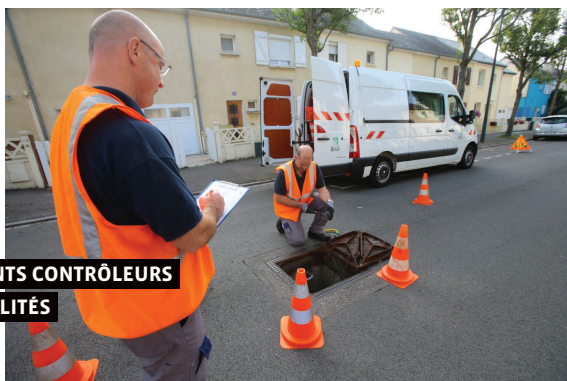
AGENTS CONTRÔLEURS HABILITÉS

Le contrôle permet aussi d'apporter des informations aux usagers sur leurs obligations de raccordement et sur le fonctionnement de leurs installations privatives d'assainissement.