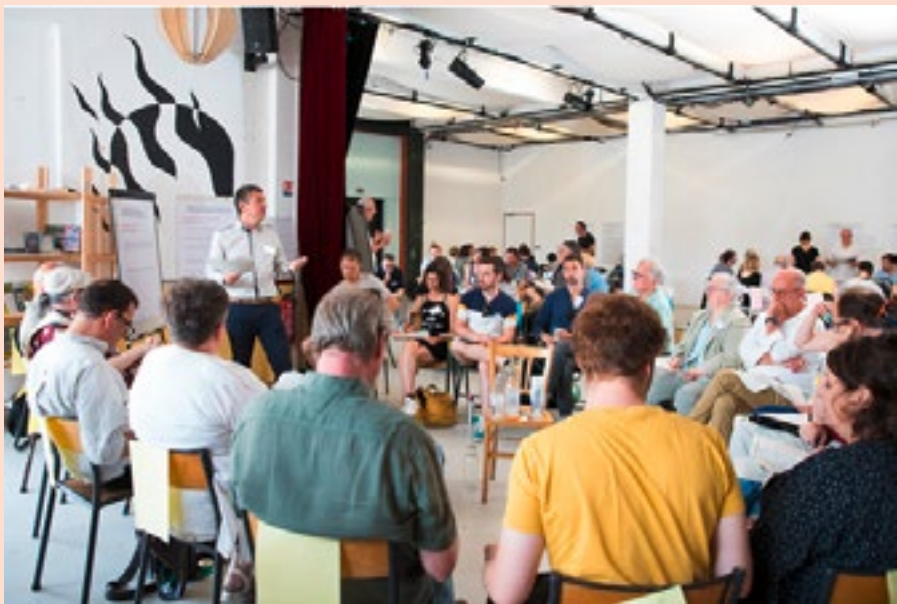
18 juin 2022 : validation de la charte par la Ville de Rennes et le secteur associatif.