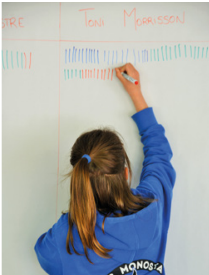
Dépouillement du vote pour le nom de la future école Europe Rochester