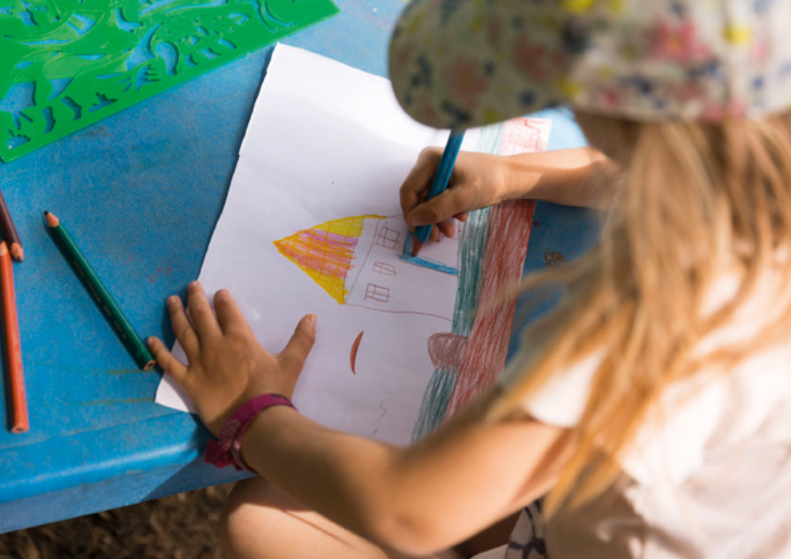
Mini-camp au centre de loisirs Savio