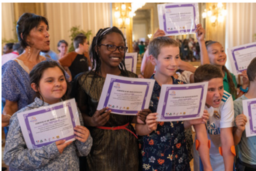
Remise des certificats d'élèves médiateurs