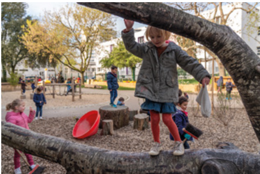
Cour de récréation rénovée de l'école de l'Îlle