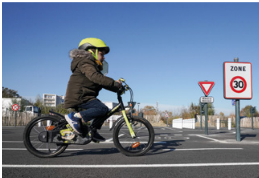
Piste ludique d'apprentissage du vélo