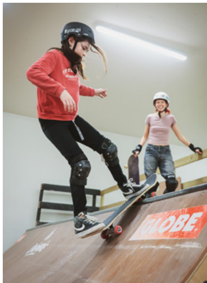
Skate féminin, association Ride like share