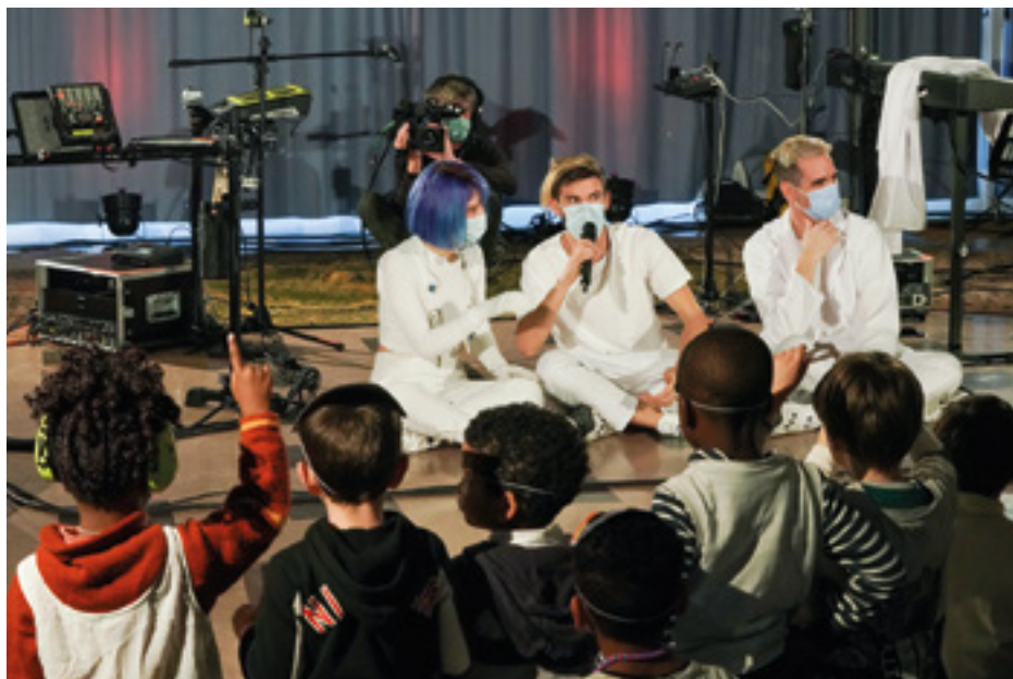
Concert du groupe IA404 dans le cadre des Transmusicales