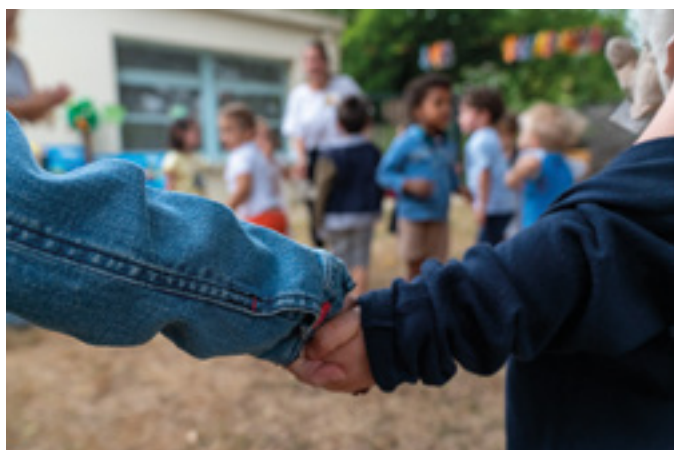
Fête au centre de loisirs Marcel Pagnol