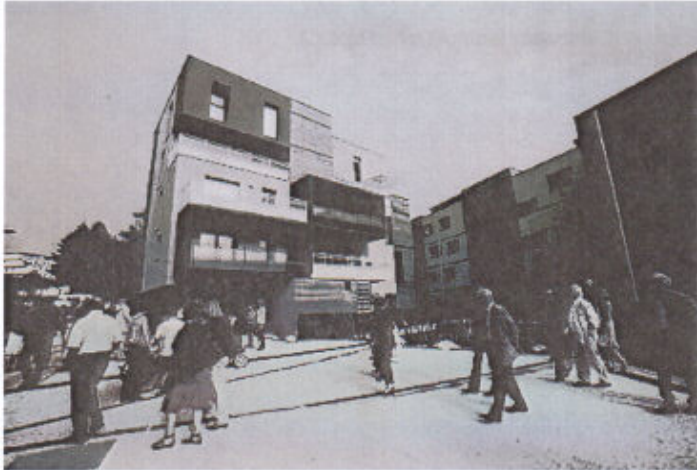
Inauguration d'un programme d'habitat collectif à Cesson-Sévigné en septembre 2014.

Au 1 er janvier 2015, avec le passage en métropole, la compétence Plan Local d'Urbanisme (PLU) a été transférée des communes à Rennes métropole. Retrouvez sur cette page les informations relatives aux procédures en cours d'adaptation des PLU communaux.