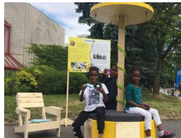
Le week-end du 2 juillet, les portraits sonores ont été diffusés sur une borne temporaire.