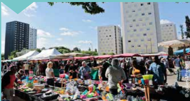
Le marché sera maintenu pendant les travaux.

durant les phases de chantier. Elles permettront enfin, en cas de besoin, d'adapter ou de rectifier les hypothèses de projet.