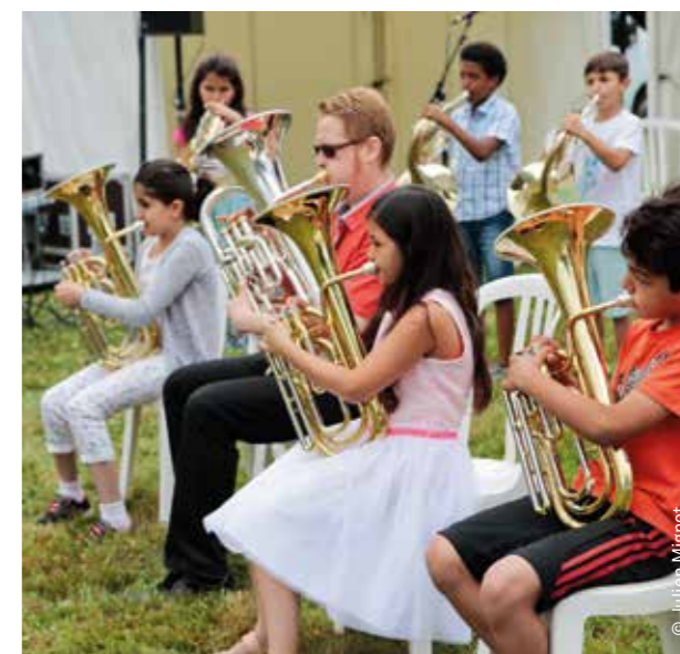
Animation musicale par les enfants des classes orchestres

Cette conférence s'est poursuivie par une visite du quartier pour découvrir les futurs projets : Pôle Économie Sociale et Solidaire, Pôle associatif, Rambla, place du Banat. La matinée s'est conclue par une animation musicale proposée par les classes orchestres de Volga, Torigné et Guillevic. Dans ces trois écoles, environ 60 enfants du CE2 au CM2 suivent trois heures d'enseignement musical sur le temps scolaire. Ce dispositif, initié par la Ville de Rennes en 2008 (en partenariat avec l'Éducation nationale et la Direction Régionale des Affaires Culturelles), devrait accueillir davantage d'enfants d'ici 2020 en prévision de l'ouverture du conservatoire.