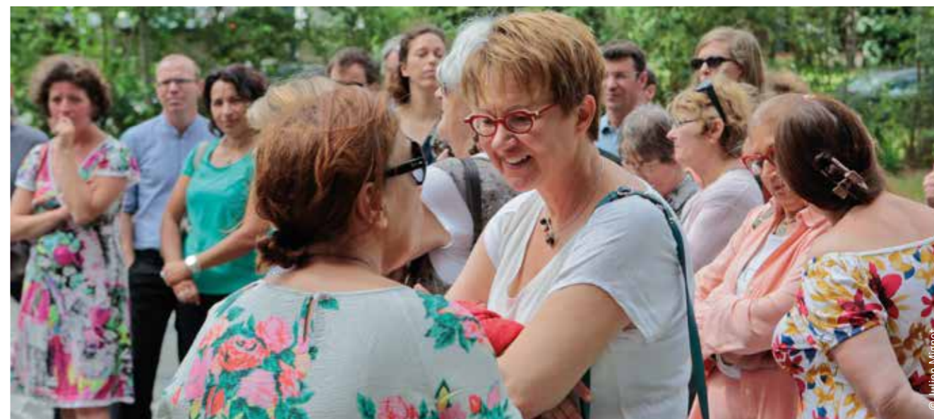
Réunion de présentation des futurs équipements du quartier, en présence de Nathalie Appéré

Le 24 juin dernier, la maire de Rennes, Nathalie Appéré, est venue au Triangle présenter aux habitants le projet du Conservatoire de Rennes qui va prendre place au cœur du Blosne près de la place de Zagreb.