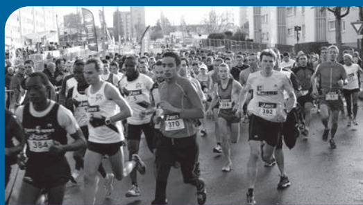
Foulées Maurepasiennes, 15ème édition