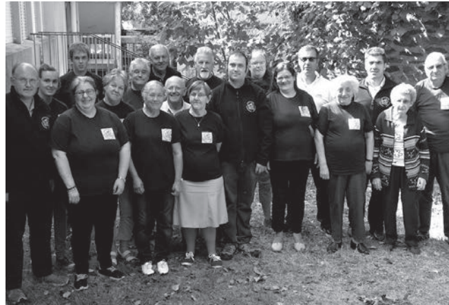
Association Maurepas St Exupéry : Continuité des animations